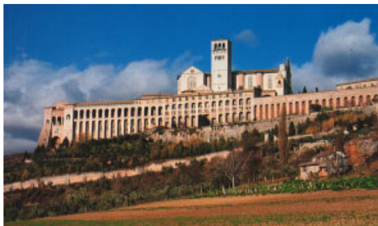
Bazilika sv. Frančiška v Assisiju, kjer je svetnikov grob