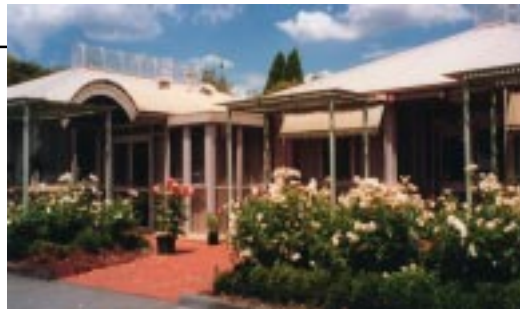
MOTHER ROMANA HOME Slovenian Hostel for the Aged Phone: 03 9853 1054 Fax: 03 9855 0811

Dom počitka matere Romane je slovenska ustanova, ki nudi bivanje v domačem okolju ostarelim in vsem, ki potrebujejo nego. Prijazna in topla soba, domača hrana, vesela družba, popolna zdravniška nega in celotna oskrba je samo del tega, kar boste našli v domu počitka le 20 metrov od slovenske cerkve v Kew.