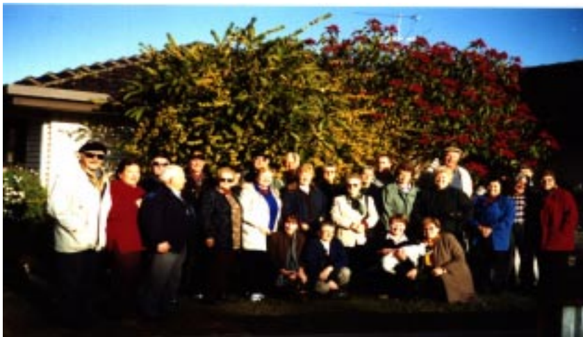
Vsa v soncu obsijana je bila pot rojakov iz Melbourn, ko so se junija 2002 peljali v Milduro.

Višek izleta pa je bilo srečanje sorojakov, živečih v Milduri in praznovanje 11. rojstnega dne samostojne Slovenije. Preizkušali smo srečo v igralnicah RSL in ob skupnih himnah naših dvojnih domovin praznovali s kapljico avstralskega vina.