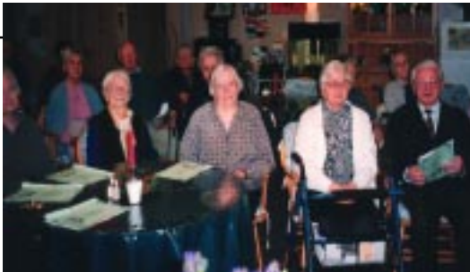
DOM POČITKA MATERE ROMANE Slovenski dom za ostarele 11-15 A'Beckett Street KEW VIC 3101