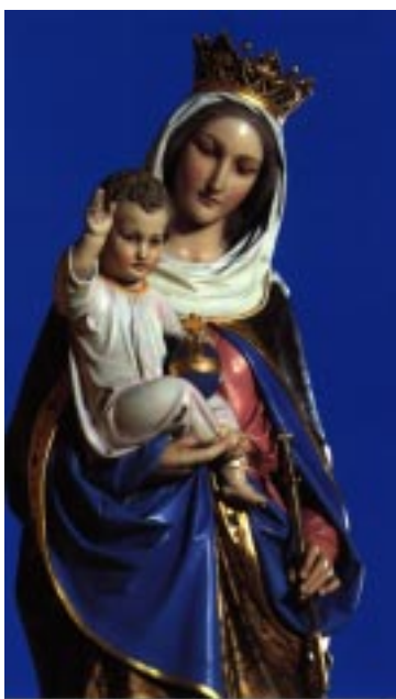
Mary, Help of Christians, zaveznica Avstralije. Ta njen kip iz 19. stoletja je v kapeli Presvetega Srca v sydneyski katedrali.