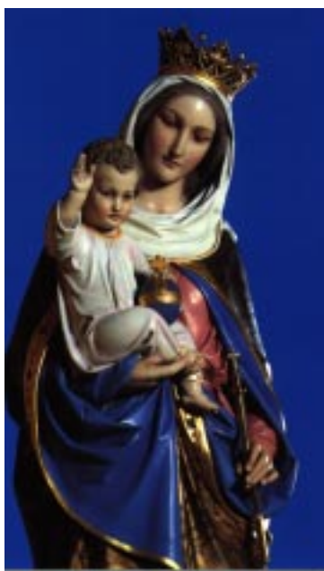
Mary, Help of Christians, zaveznica Avstralije. Ta njen kip iz 19. stoletja je v kapeli Presvetega Srca v sydneyski katedrali.

In sedaj še nekaj besed z upravnikove mize. Hvala za vse plačane naročnine in darove v Sklad p. Bernarda. Misijonarka Marija se je potrudila in naredila seznam vseh, ki ste do 10. maja 2002 vplačali naročnino in darovali v Sklad ali kakšne druge dobre namene.