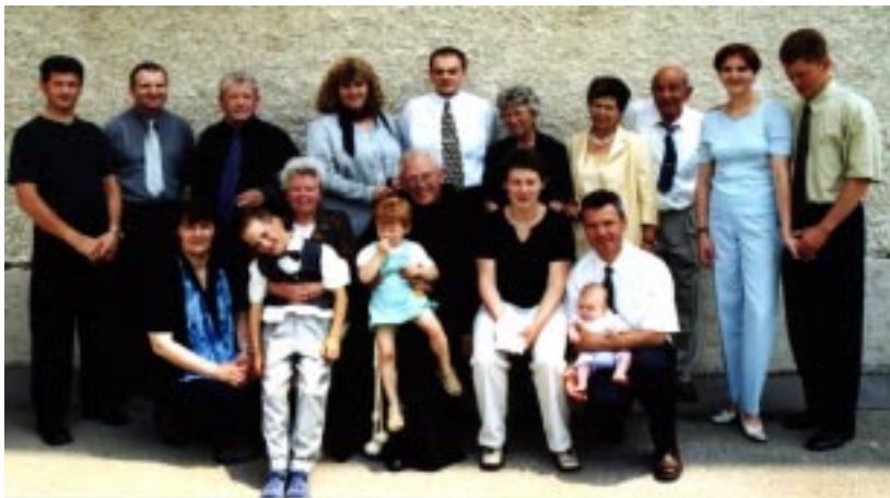
Zlatomašnik in njegove sestre in brat z družinami.