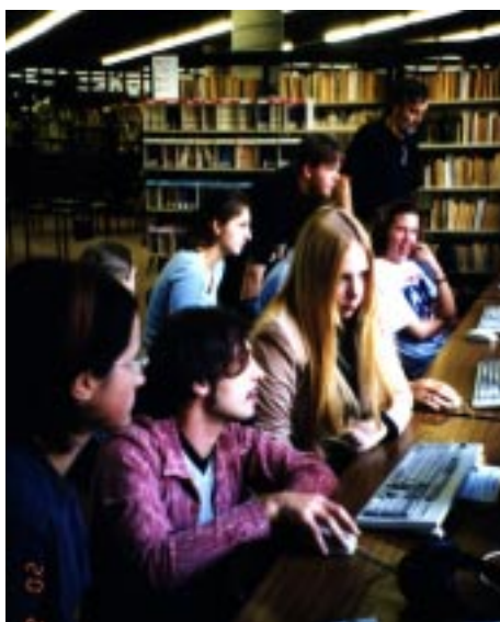
Internet v slovenskem razredu.