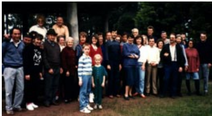
Šolski izlet na Yangeen Reservoir v Viktoriji, 1989.