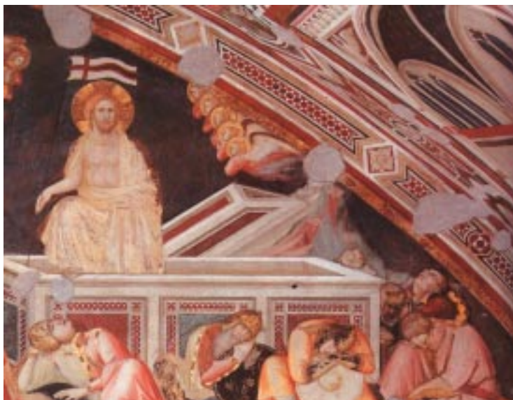
Lorenzettijeva freska vstajenja v spodnji cerkvi bazilike svetega Frančiška v Assisiju.