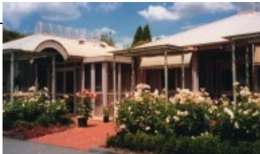
MOTHER ROMANA HOME Slovenian Hostel for the Aged Phone: 03 9853 1054 Fax: 03 9855 0811

Dom počitka matere Romane je slovenska ustanova, ki nudi bivanje v domačem okolju ostarelim in vsem, ki potrebujejo nego. Prijazna in topla soba, domača hrana, vesela družba, popolna zdravniška nega in celotna oskrba je samo del tega, kar boste našli v domu počitka le 20 metrov od slovenske cerkve v Kew.