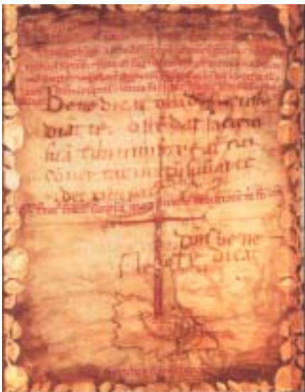
Franèiškov blagoslov bratu Leonu.

»Ljubi, ljubi moj oèe,« je zašepetal, »nikoli ne pozabim, nikoli!« In je odhitel v gozd in nobene èrne misli ni bilo veè vanj. Franèišek je gledal za njim, potem se je ozrl na šopek in dejal Gospodu: Za te moje brate, Jezus, prisrèno zahvaljen!«