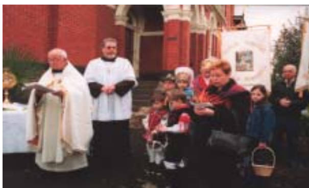
Oltar, ki so ga pred Lurško votlino postavili èlani slovenskega društva St. Albans (foto levo), desno pri oltarju slovenskega društva Planica.

Veselim dnem - za trdnega kristjana bi morali biti tudi taki dnevi veseli, ali vsaj pogum vzbujajoèi