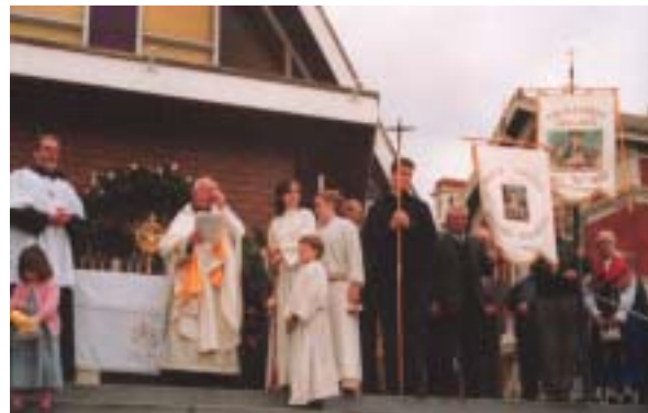
Procesija Sv. Rešnjega Telesa 22. junija 2003 v Kew: levo pri oltarju, ki so ga postavili člani Slovenskega društva Melbourne, desno oltar, ki so ga postavili člani kluba Jadran.