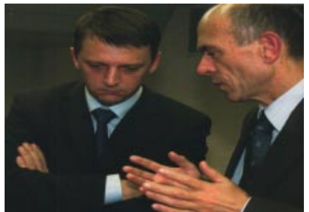
Novi predsednik države RS dr. Janez Drnovšek (desno) v pogovoru z novim predsednikom slovenske vlade Antonom Ropom (levo).

Ljudska stranka in Demokratična stranka upokojencev), ki imajo skupaj s poslancema narodnosti v parlamentu dvetretjinsko večino. Tako široka podpora je za vlado pomembna zaradi ustavnih sprememb, ki jih pripravlja pred vstopom v Evropsko zvezo in NATO, kamor naj bi se