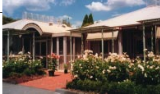
MOTHER ROMANA HOME Slovenian Hostel for the Aged Phone: 03 9853 1054 Fax: 03 9855 0811

Dom počitka matere Romane je slovenska ustanova, ki nudi bivanje v domačem okolju ostarelim in vsem, ki potrebujejo nego. Prijazna in topla soba, domača hrana, vesela družba, popolna zdravniška nega in celotna oskrba je samo del tega, kar boste našli v domu počitka le 20 metrov od slovenske cerkve v Kew.