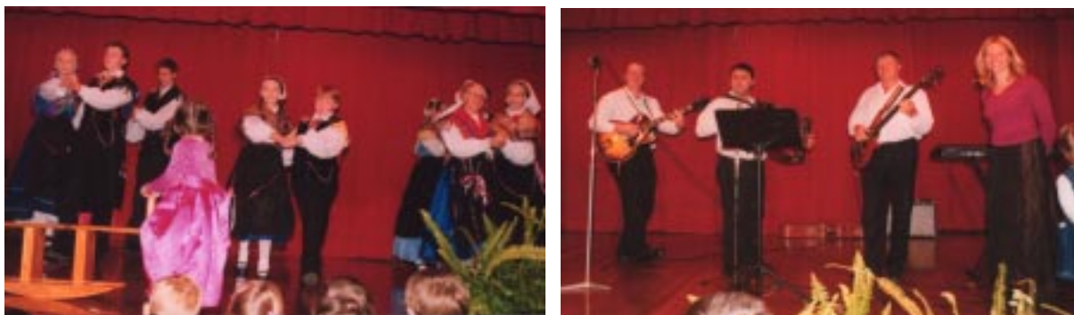
Folklorna skupina Iskra in ansambel Avstralskih pet na praznovanju materinskega dne.