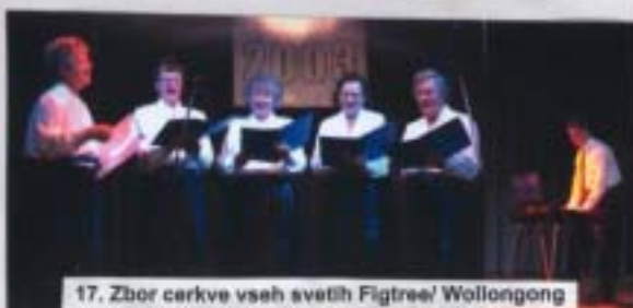
17. Zbor cerkve vseh svetih Figtree! Wollongong