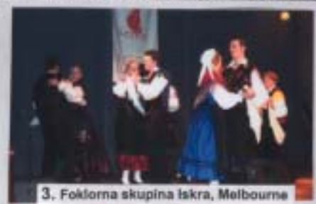
3. Foklorna skupina Iskra, Melbourne