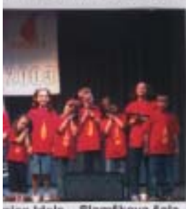
nian Idols – Stomškova soča