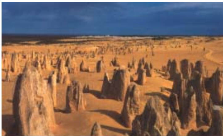
V bli•ini oceana je pušèavska planjava Pinnacles.

Zahodna Avstralija je zelo znana po cveticah. Tako smo izkoristili priliko in si ogledali park, ki je kot botanièni vrt z vsemi zahodnoavstralskimi cveticami in grmièevjem. Zelo zanimivo za nekoga, ki ga zanima botanika.