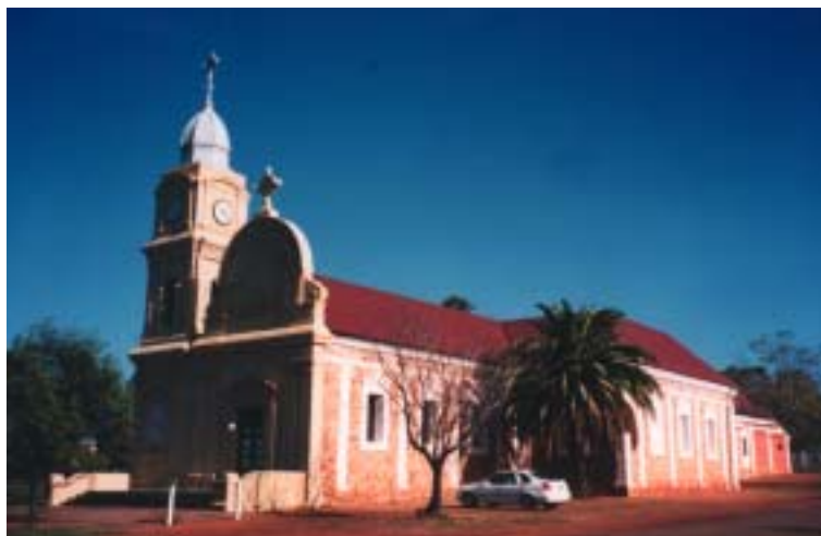
Jutranje sonce je obsijalo cerkev v New Norcia.

na stanovanje in hrano ljudi zastoj, kar je še vedno pravilo. Zaradi velikih stroškov •al tega ne zmorejo veè, zato je 50 dolarjev na dan za hrano in stanovanje po osebi. Èe nekdo ne zmore plaèati cene, ga še vedno sprejmejo, drugi pa pustijo prostovoljne prispevke v kuvertici pri vhodu. Èe se •eli kdo pridru•iti patrom pri molitvah, je dobrodošel, enako, èe ostane dalj èasa tam, lahko pomaga na vrtu.