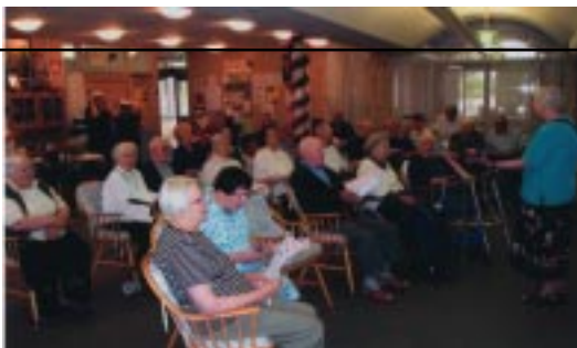
DOM POČITKA MATERE ROMANE Slovenski dom za ostarele 11-15 A'Beckett Street KEW VIC 3101