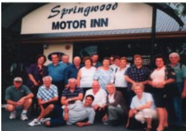
Igralci pred motelom v Springwoodu, Brisbane.

Ne smemo seveda pozabiti Materinskega dne en teden kasneje, dan, ki je že po stari tradiciji eden od redkih dni, ko vidimo v naših dvoranah in na naših prireditvah tudi drugo in tretjo generacijo avstralsko slovenskih družin, ko otroci želijo posebno razveseliti svoje starše in pripeljejo tudi svoje otroke s seboj v klub ali dom, kamor starši res radi prihajajo, da bi proslavili mamin dan.