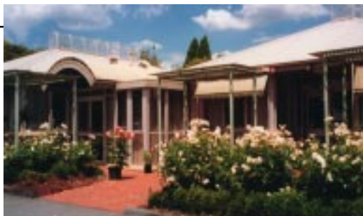
MOTHER ROMANA HOME Slovenian Hostel for the Aged Phone: 03 9853 1054 Fax: 03 9855 0811

Dom počitka matere Romane je ustanova slovenskega misijona v Melbournu, ki nudi bivanje v domačem okolju ostarelim in vsem, ki potrebujejo nego. Prijazna in topla soba, domača hrana, vesela družba, popolna zdravniška nega in celotna oskrba je samo del tega, kar boste našli v domu počitka ob cerkvi v Kew.