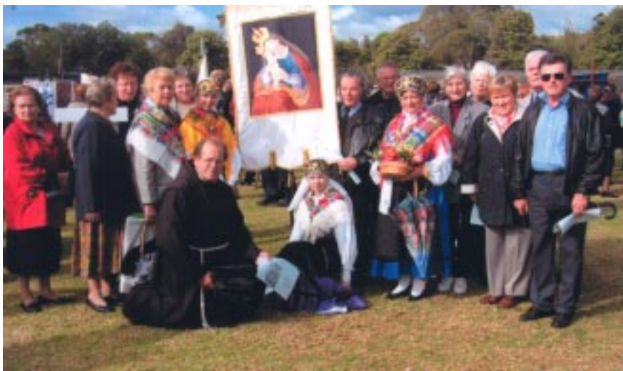
Marija Pomagaj povezuje slovenski narod v domovini in izseljenstvu.