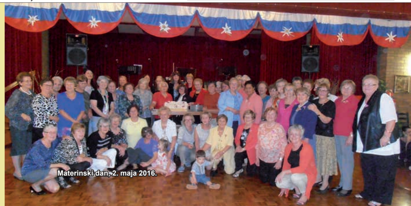
Materinski dan, 2. maja 2016.