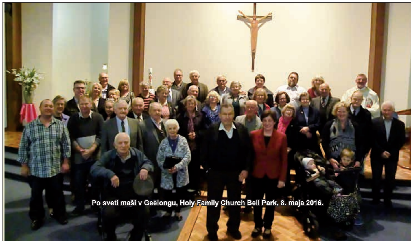
Po sveti maši v Geelongu, Holy Family Church Bell Park, 8. maja 2016.