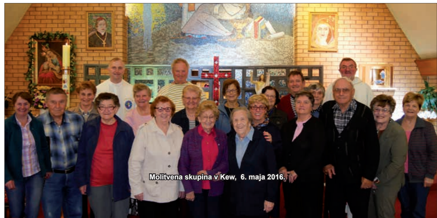
Molitvena skupina v Kew, 6. maja 2016.