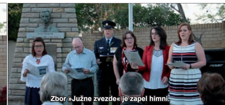
Zbor »Južne zvezde« je zapel himni.