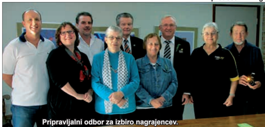
Pripravljalni odbor za izbiro nagrajencev.

Pripravljalni odbor Triglav Mounties Slovenian Community Awards 2016