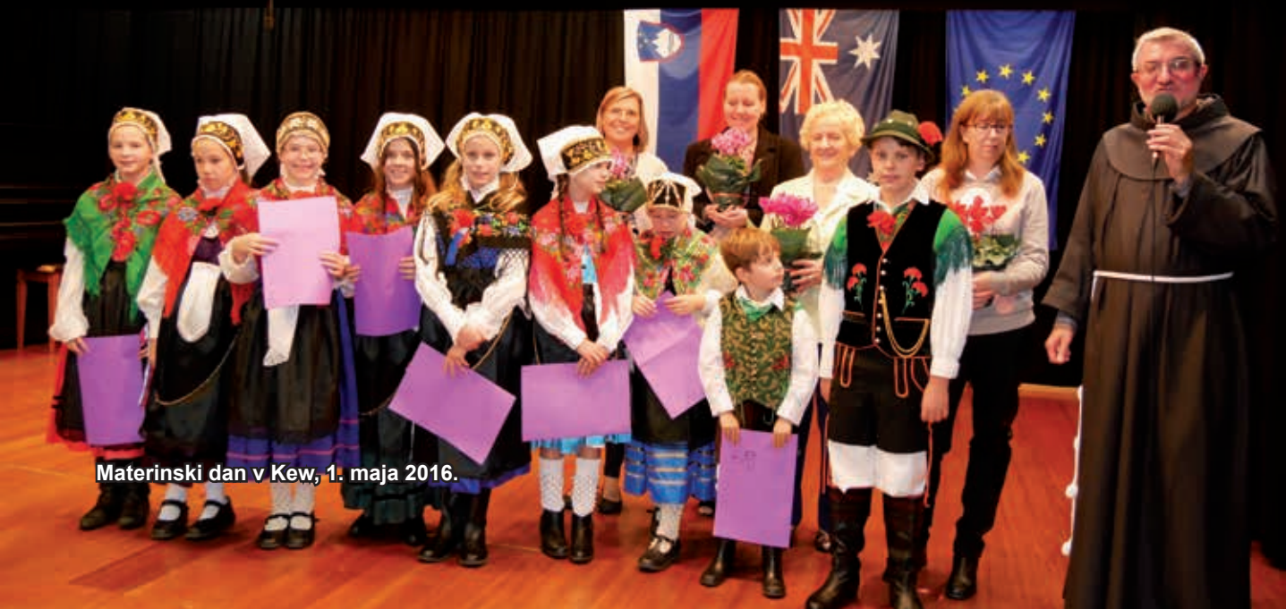
Materinski dan v Kew, 1. maja 2016.