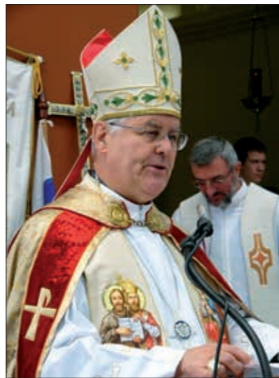
Škof msgr. Metod Pirih nas je zadnjič obiskal leta 2008. Z Mislimi mu pošiljamo čestitke!

Nekdanji koprski škof msgr. Metod Pirih je 9. maja 2016 obhajal svoj osebni jubilej, osemdeset let življenja. Rodil se je 1936 se je v Lokovcu na Banjški planoti. V duhovnika je bil posvečen leta 1963, v škofa pa leta 1985. Več kot četrto stoletje je vodil koprsko škofijo, zadnja štiri leta pa iz Vipave, kjer biva, pomaga sedanjemu ordinariju v Kopru, škofu Juriju Bizjaku. Za dar življenja se je skupaj s škofom Jurijem, duhovniki in verniki zahvalil na binško soboto zvečer v koprski stolnici. Na začetku maše mu je škof Jurij, ki je somaševal z njim, voščil za njegov življenjski jubilej. Škof Metod je na začetku pridige dejal, da se želi zahvaliti za dar življenja, za duhovniški poklic in vse dobro, ki ga je lahko opravil v duhovniški in škofovski službi ter prosil odpuščanja za vse, kar je bilo narobe. Glavni del pridige pa je namenil razmišljanju o Cerкви, katere del smo tudi mi in je dar Svetega Duha.