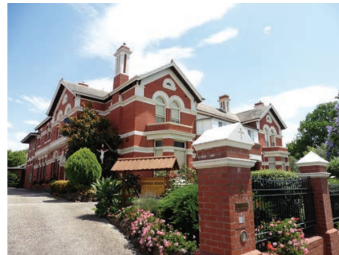
Baragov dom - Baraga House, sedež slovenskega misijona v Melbourne.

30. junija 2018 se bo ob 7.00 v okviru Baragovih dni začel pohod po Baragovi poti od župnijske cerkve v Trebnjem (izpred