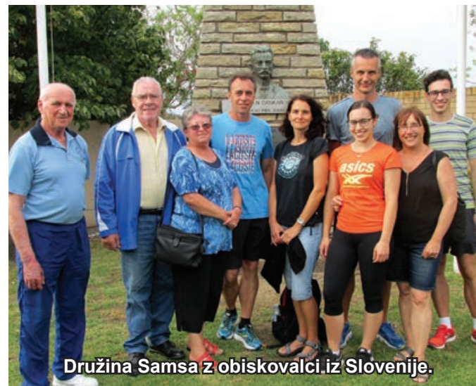
Družina Samsa z obiskovalci iz Slovenije.

zapeli zbirko priljubljenih pesmi v vsaj štirih jezikih, nakar so se vrnili na balinarske steze za tretjo igro in potem za finale med štirimi najboljšimi skupinami