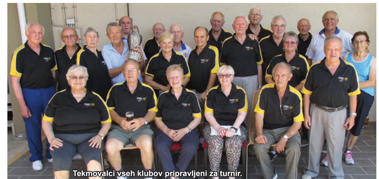
Tekmovalci vseh klubov pripravljeni za turnir.

Dan Samostojnosti Republike Slovenije. Podelitev priznanj Slovenske Skupnosti za leto 2018. Za ples igra ansambel Alpski Odmevi .