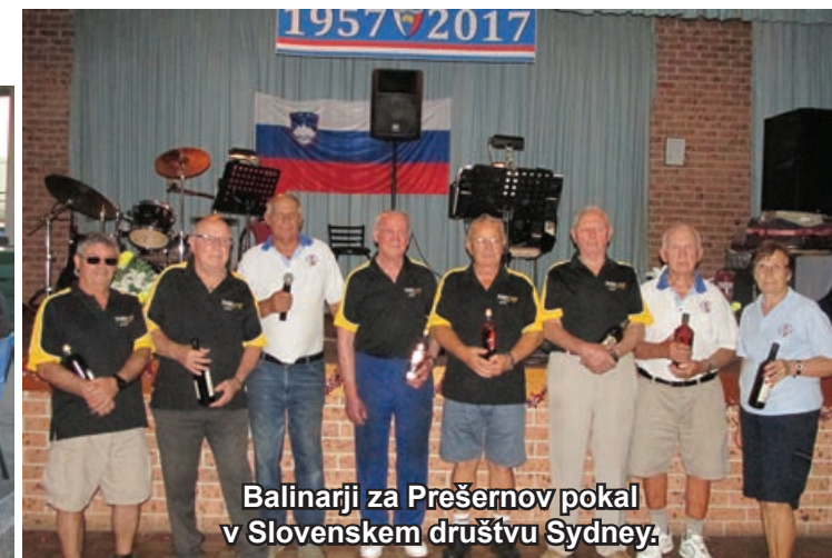
Balinarji za Prešernov pokal v Slovenskem društvu Sydney.

zapeli zbirko priljubljenih pesmi v vsaj štirih jezikih, nakar so se vrnili na balinarske steze za tretjo igro in potem za finale med štirimi najboljšimi skupinami