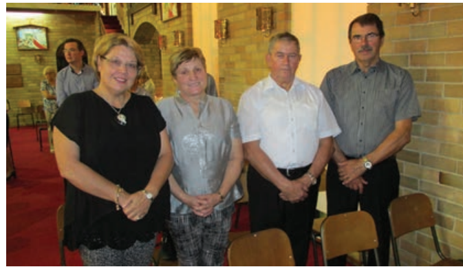
Lahovi so imeli obiske iz Slovenije.