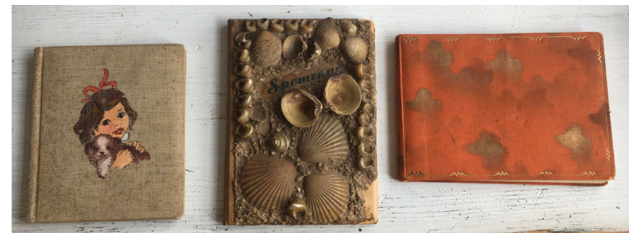
Spominske knjige od mene, Branetove mame in mamice

Naslednjič pa se bom spet malo bolj posvetila mojemu ljubemu rastlinskemu in živalskemu svetu. Na pravkar zaključenem izobraževanju o gobah sem izvedela res neverjetne stvari. Boste videli!