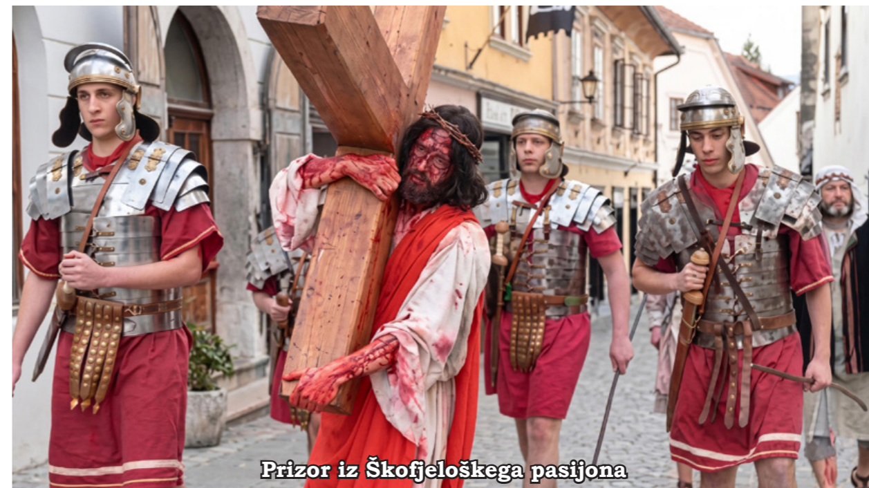
Prizor iz Škofjeloškega pasijona

Letos, ko je bilo po dolgem času spet leto Škofjeloškega pasijona, nanj nisem mislila iti; zapomnila sem si ga kot dogodek, ki ga vidiš enkrat in si ga zapomniš za vse življenje. Potem pa je znanka kupila karto preveč in mi ponudila, da grem z njimi. Predstava je bila ravno na predvečer cvetne nedelje, pa še tako udobno sem samo prisledla v avto, brez skrbi, kako se bom pozno ponoči sama vračala čez Gorjance (od Semiča do Škofje Loke je namreč kar dobri dve uri vožnje). Že nekaj kilometrov pred škofjeloškim centrom smo imeli na voljo parkirišča, kjer smo presedli na posebej za to organizirane avtobuse, ki so občinstvo zapeljali do središča starega mesta. Lepo je bilo videti gruče ljudi s košarami, nahrbtniki, odejami (konec marca so bile noči še zelo hladne) – sodobni romarji, ki smo se prek mostiča, osvetljenega z baklami, zgrinjali med umetelne starodavne fasade mogočnih hiš; v temo Jezusovega križanja, v Jeruzalem leta 33 po Kristusu. Čisto