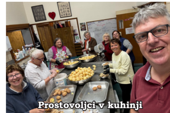
Prostovoljci v kuhinji

Novembra 2025 smo praznovali 70 let obstoja kluba Ivana Cankarja v Geelongu. Vsem se iskreno zahvaljujemo za udeležbo in za to, da je bilo praznovanje 70. obletnice tako čudovit in nepozaben dogodek. Zahvaljujemo se vsem prostovoljcem, ki so si vzeli čas in vložili toliko truda, da je bil ta dan uspešen. Prav tako bi se radi zahvalili vsem podjetjem in članom kluba za njihove donacije, za tombolo in druge dejavnosti zbiranja sredstev.