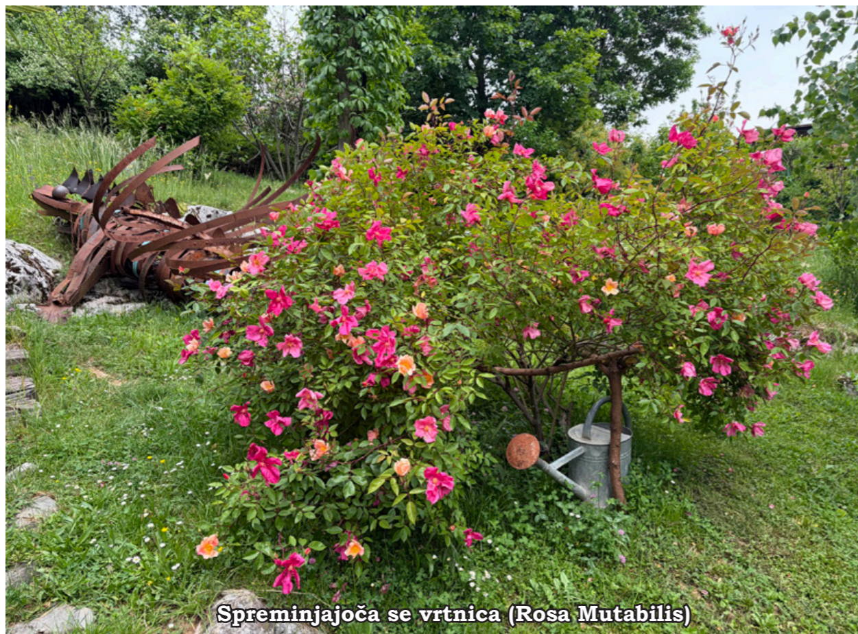
Spreminjajoča se vrtnica (Rosa Mutabilis)

Dotaknila se me je letos, še bolj kot ponavadi, ta Jezusova samota. Kako sam je bil na koncu, nerazumljen, zaradi svoje vere celo preziran. In bolj kot ponavadi sem tudi razumela, zakaj so ga v smrt pognali isti ljudje, ki so ga prej oboževali.