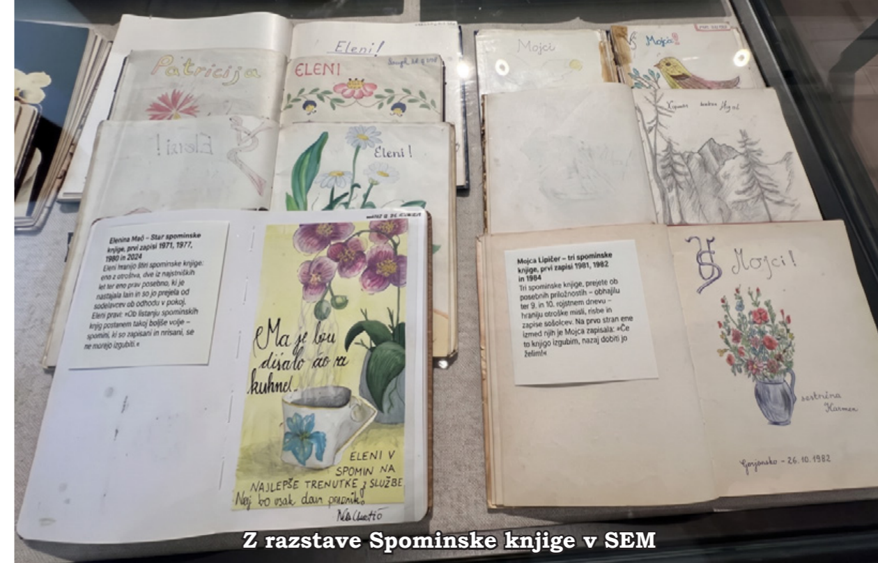
Z razstave Spominske knjige v SEM

Ker ga na neki točki niso več razumeli. Tuj jim je postal zaradi svoje nepremakljive moralne drže. Zaradi nedojemljive, brezkompromisne ljubezni do njih, ki je niso bili sposobni. Najbrž se to dogaja z leti: starejši, kot si in bližje, kot si tudi svojemu koncu, bolj razumeš pasijonsko tragedijo – kako smo s starostjo zmeraj bolj sami in nerazumljeni. Znameniti švicarski psihiater in psiholog Carl Gustav Jung, ki je bil strokovnjak na področju človeških čustev, je o samoti povedal: »Človek ni osamljen zato, ker okrog njena ni ljudi, ampak, ker je nesposoben drugemu razložiti stvari, ki so zanj pomembne.« Prava osamljenost torej ni, da si sam, ampak da z drugimi ne moreš deliti svojega notranjega sveta. Odnosi zahtevajo razumevanje, ne samo navzočnosti.