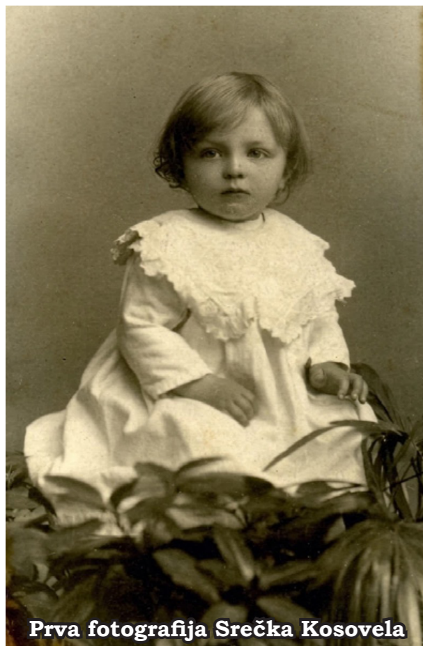
Prva fotografija Srečka Kosovela